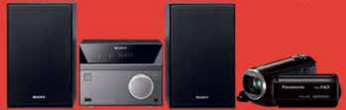
IMAGEN & SONIDO