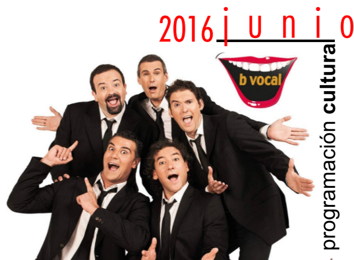
veinte con nosotros