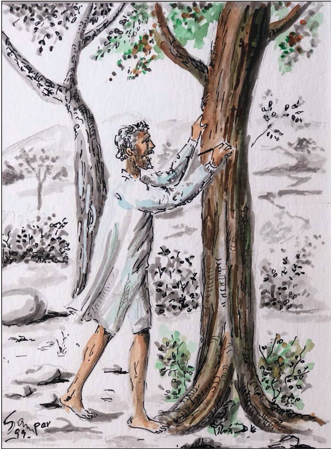
A mi amada Dulcinea. Acuarela. J.L. Samper