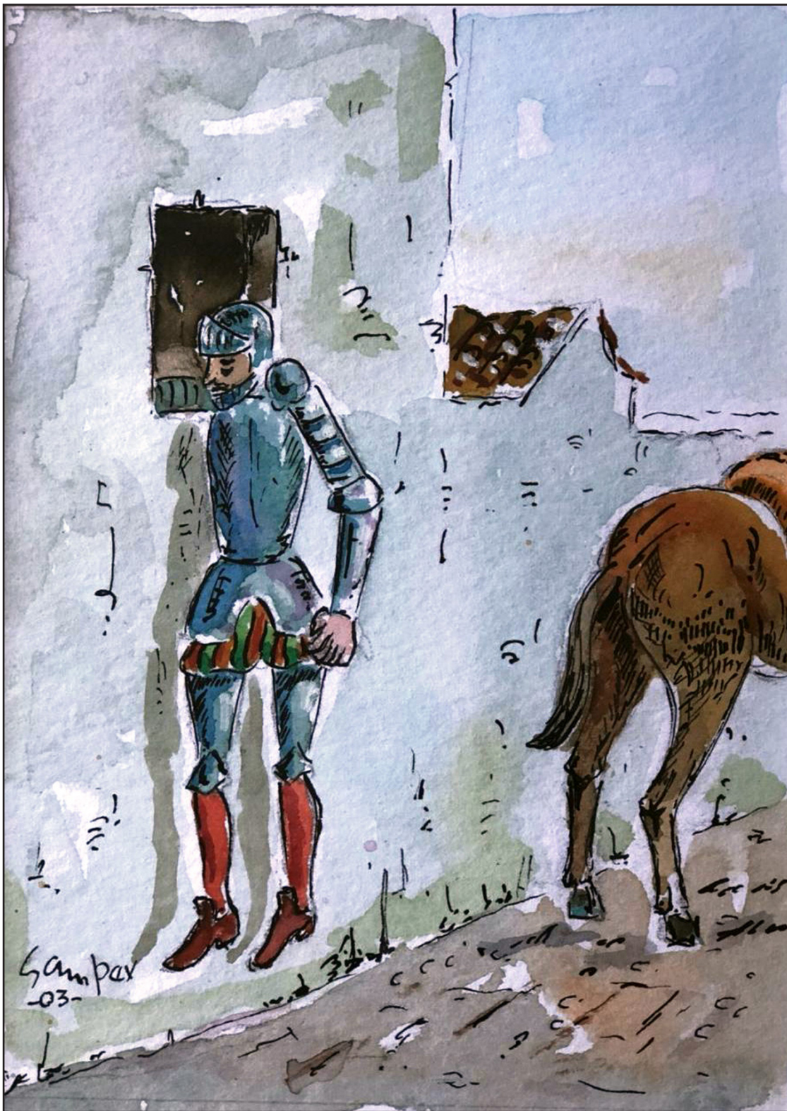
Atrapado. Acuarela. J.L. Samper