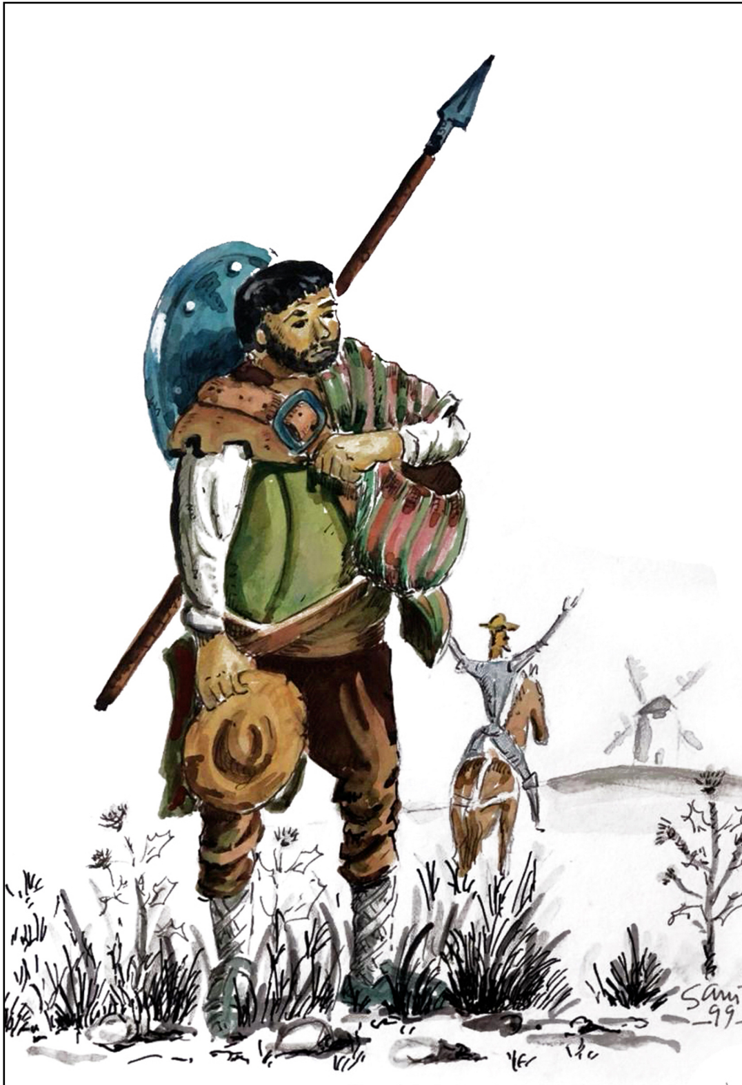
Sancho Panza. Acuarela. J.L. Samper