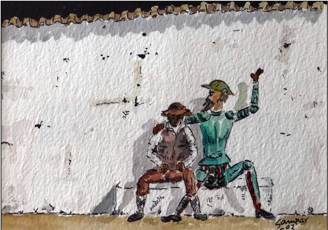
“Amigo Sancho” J.L. Samper