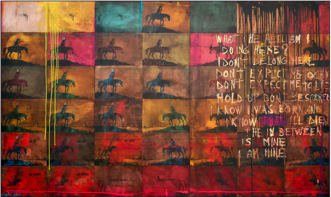
Don Quijote y la luna (200 x 125). Salvador Samper