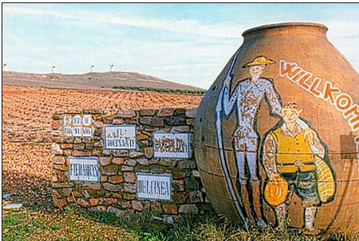
La misma imagen tomada desde el punto de vista anterior pero a mediados de la década de 1970