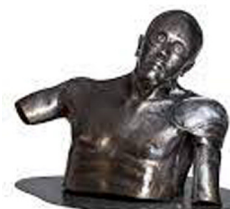
La revelación del Quijote . Austión Tirado 2017