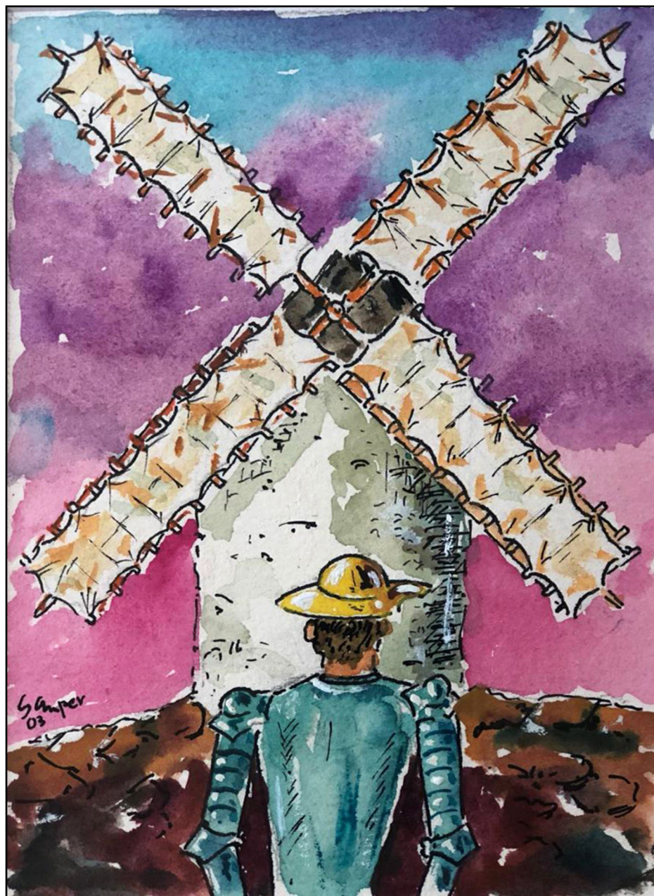
Cara a cara. Acuarela. J.L. Samper