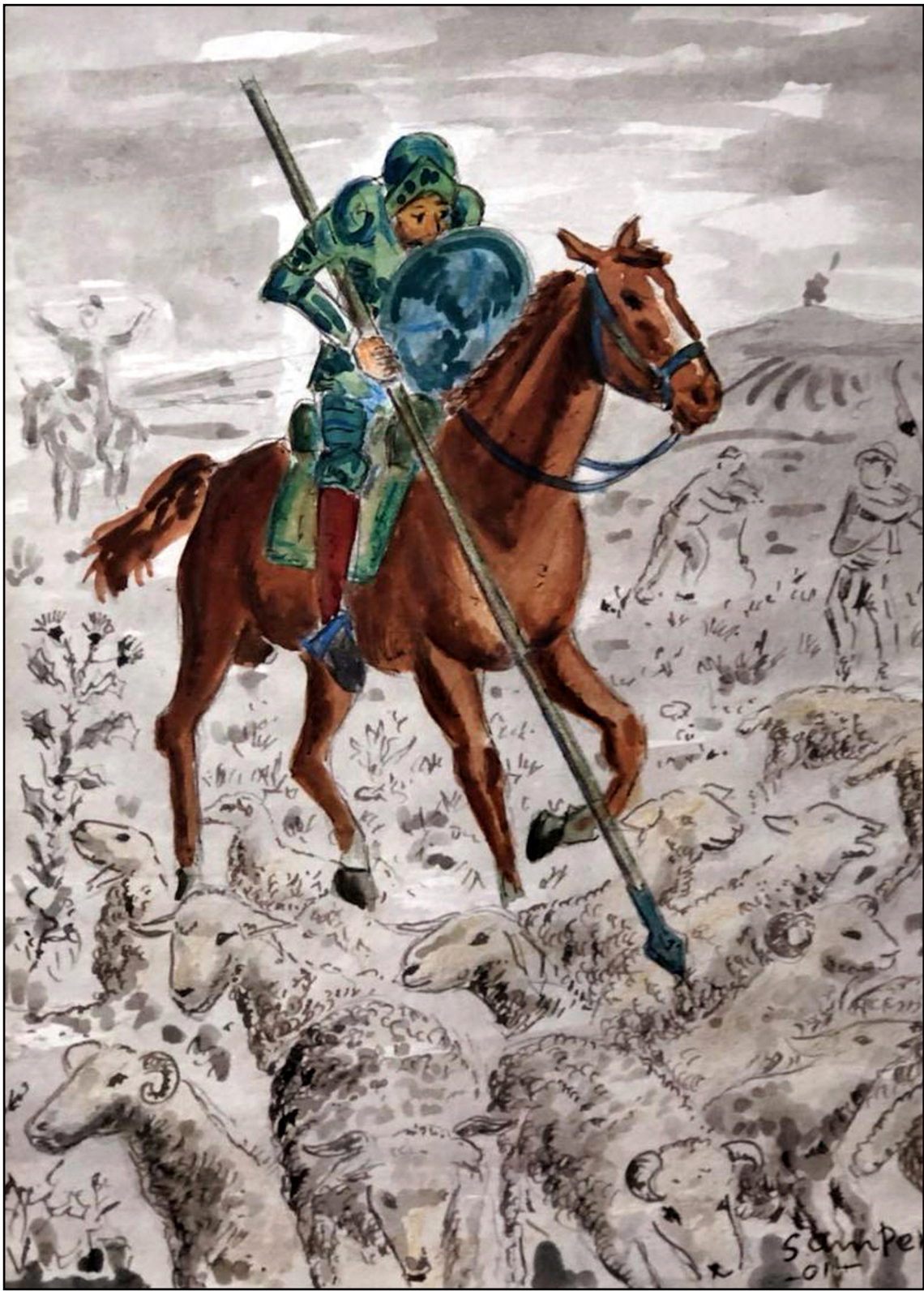
Atacando el rebaño. Acuarela. J.L. Samper