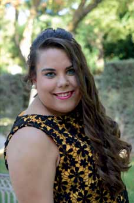
LARA Lázaro Ramos