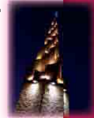
Monumento a las Víctimas del Terrorismo