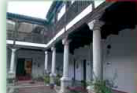
Patio del museo López Villaseñor