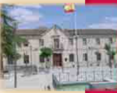
Real Casa de la Misericordia