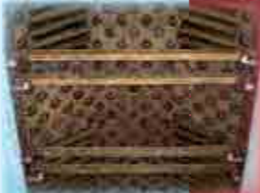
Artesonado Iglesia de Santiago