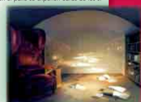
Museo del Quijote