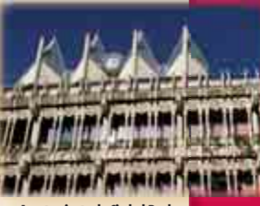
Ayuntamiento de Ciudad Real