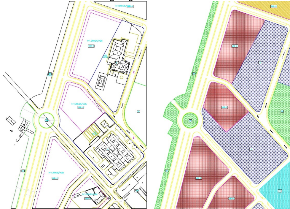
Esta es la ordenación propuesta por el estudio de detalle inicial de fecha 28/11/2011:

El PGOU estableció una ordenación estructural y detallada para la manzana objeto del presente Estudio de Detalle, determinando sus alineaciones exteriores y los parámetros para las edificaciones conforme a la imagen siguiente: