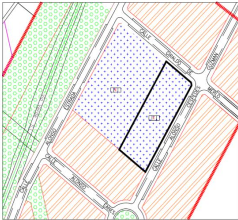
Dotacional Pública, Educativa/Cultural. E, BLQ-SE

Por Decreto número 2024/629 de fecha 06/02/2024 se acuerda someter a información pública por período mínimo de un mes, la Modificación puntual N° 17 del PGOU. Modificación de calificación de parcela dotacional educativa a dotacional genérica, calle Alonso Céspedes Guzmán, 8, conforme a lo dispuesto en arts. 36 y 37 del TRLOTAU y concordantes.