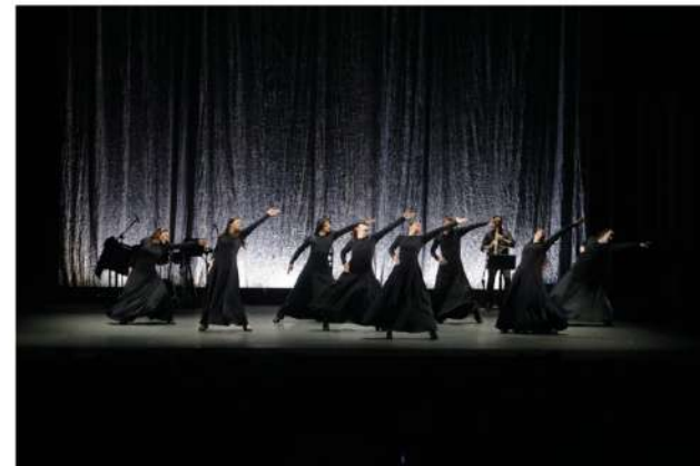
Comedia sin título